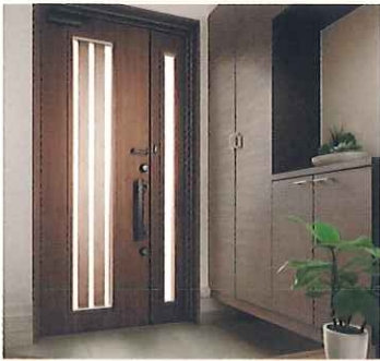
リフォーム玄関ドア リシェント

ピッキングやこじ開け、ガラス破り対策をした防犯対策が標準装備。電気錠タイプならカギの閉め忘れも予防できます。壁を壊さない簡単リフォーム。断熱仕様なら補助金対象に。