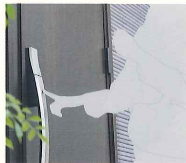
スマートロックシステムFamiLock

FamiLock ならカギを出す手間もなく、ラクラク施錠。ボタンを押してカードをかざすタイプやスマートフォンやリモコンでピッと開けられるタイプなど選べます。